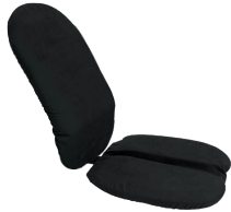
14. Salli Driver